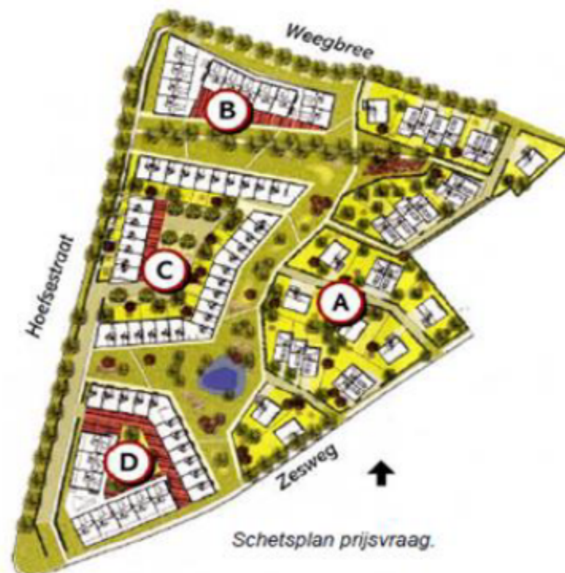
Figuur 1: Ontwerp Tuin van Woezik